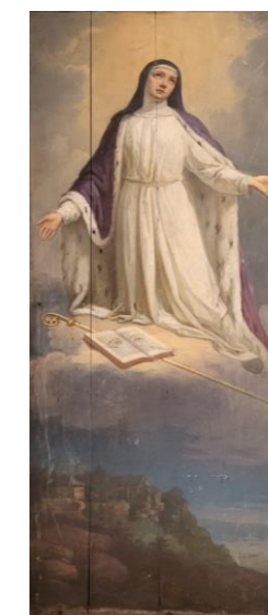
Sanctuaire du Mont Sainte Odile

Une espérance première dans la Providence bienveillante du Père. Odile, depuis sa jeunesse, a mis sa confiance en Dieu seul, et rien n'a pu l'en détourner.