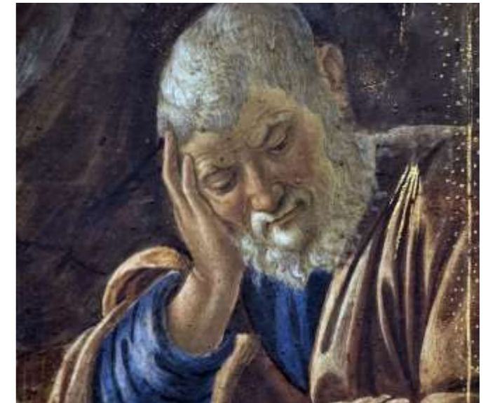
"L'Adoration des Mages" (1475-1477), Botticelli, Florence, détail.

La proclamation de l'Évangile nous annonce la vie éternelle, ainsi que la possibilité d'y accéder dans le Christ Jésus. Mais ce n'est pas seulement une bonne nouvelle pour « après la mort » : c'est aussi une réalité pour aujourd'hui. Il découle de cela que nous vivons, pour ainsi dire, deux vies en même temps : celle de tous les hommes et, depuis notre baptême, celle des enfants de Dieu. Dès aujourd'hui, la foi nous fait ouvrir les yeux sur cette vie qui reste inconnue pour le monde, et qui pourtant remplit l'univers. La conséquence la plus évidente de cette mystérieuse double vie des chrétiens est le fait que nous avons chacun deux pères : un de la terre, et un du ciel. Tous nos pères, avec leur histoire, leur joie et leurs souffrances, leurs qualités et leurs défauts, nous sont donnés pour que nous puissions accéder à Dieu, qui est « Notre Père » depuis le baptême, et en réalité depuis toujours. Il y a ici un très grand mystère : pourquoi le Tout-Puissant a-t-il choisi de nous révéler la perfection de son amour à travers l'imperfection de ceux qui nous ont engendrés ?