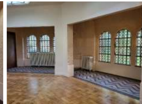
Grande salle ouverte