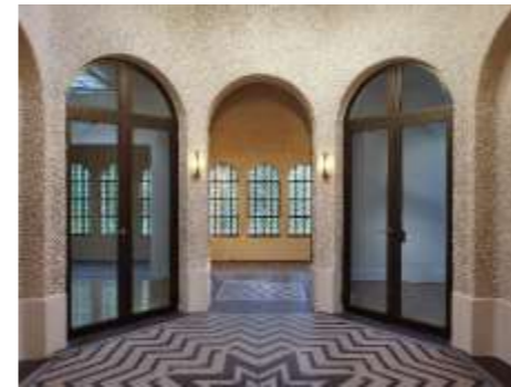
Ouverture sur la Rotonde au rez-de-chaussée