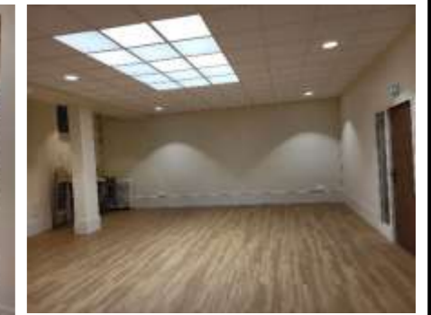
Salle Pierre l'Ermite sous-sol